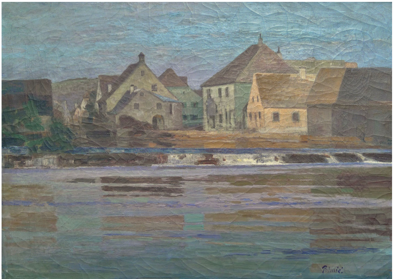
Palmié, Kallmünz, Öl auf Leinwand, 72 x 96 cm

Der Bergverein Kallmünz widmet dem Künstler die Ausstellung: „Kallmünz.01 – wie alles anfangt! Charles Palmié – 120 Jahre Perle des Naabtals“, mit Originalgemälden und Photographien von Palmié und anderen Künstlern, die mit ihm in Kallmünz waren. 18.9. bis 1.11.2021 im alten Rathaus in Kallmünz.